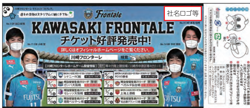
ポケットティッシュとマスク(デザインは2019年のものです。)